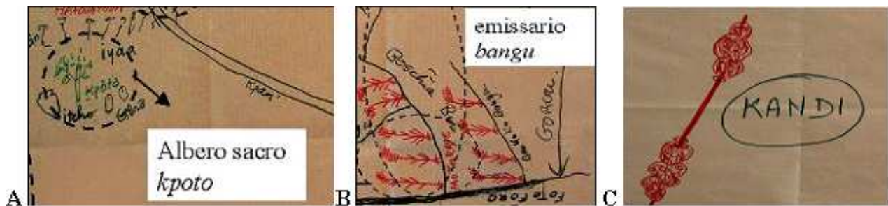
Figura 2 – Esempi di icone riferite ai saperi simbolici, funzionali e giurisdizionali