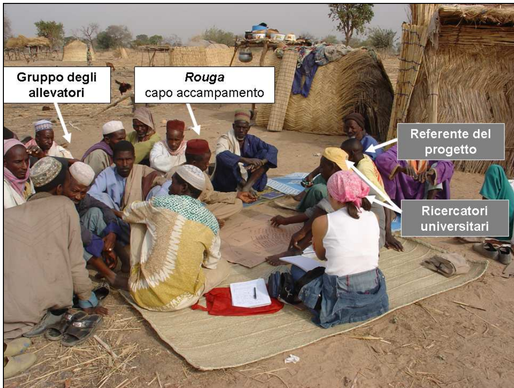
Figura 1 – Gli interpreti coinvolti nel disegno partecipativo presso l'accampamento di Kiwirkoye (Niger)